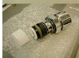
Artikel Nr. 76.001.017