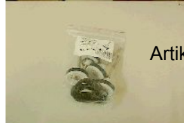
Artikel Nr. P 90505

Begrenzung der Mischwassertemperatur: Mit Hilfe des Griffes die gewünschte maximale Temperatur einstellen: Mutter 1 aufschrauben bis Ring 2 sich frei drehen kann. Mit Hilfe eines Zylindrischen Werkzeuges Ø 4,5, das man in die Bohrung 3 einführt, den Ring 2 von links nach rechts drehen bis zum Anschlag. Mutter 1 wieder fest anschrauben.